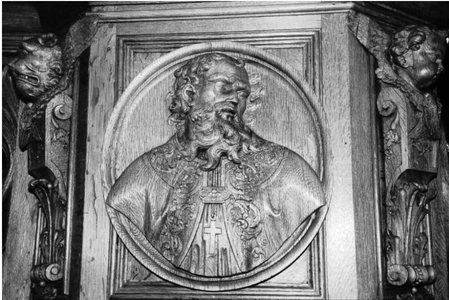
Onze-Lieve-Vrouwekerk te Veldegem. Paneel op de preekstoel. Boven: ??? en onder ???. Eigen foto 1988.

kerkfabriek van Lichtervelde het verlangen hadden om te vernieuwen, moge blijken uit het feit dat die zogezegde gammele preekstoel, zij het hersteld, tot op heden dienst doet in de Onze-Lieve-Vrouwekerk van Veldegem.