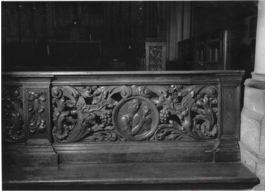
Bovenaan de Liefde, voorgesteld door een vlammend hart en onderaan het Berouw. Bemerkt tevens het zwierig lijnenspel van volutes, acantusbladeren, korenaren en druiventrossen.