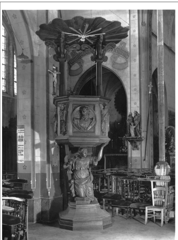
De preekstoel van de Onze-Lieve-Vrouwekerk te Veldegem, oorspronkelijk opgesteld te Lichtervelde