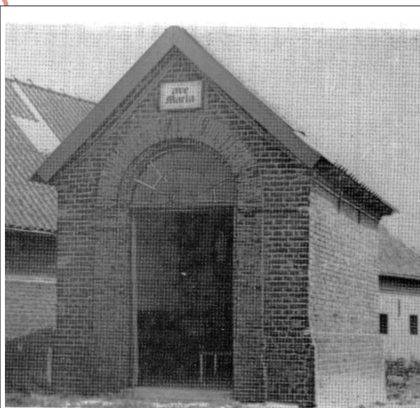
De kapel, zoals ze er tot in 2000 uitzag.

Tijdens de eerste wereldoorlog had er een hallucinante gebeurtenis plaats in de kapel. Al de hoeven in de streek waren bezet door Duitse soldaten. Een Duitse generaal, waarschijnlijk zwaar gekwetst aan het front, werd stervend teruggebracht naar één van de omliggende hofsteden. Hij overleed er na korte tijd. Het lijk werd naar de