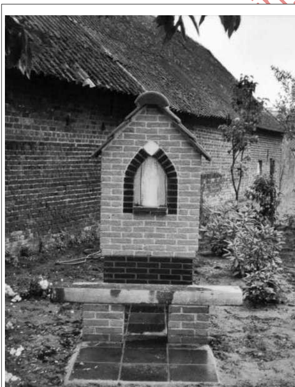
De nieuwe kapel met zitbank ervoor.