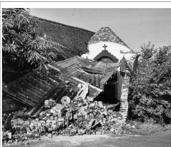
De puinen, na de aanrijding.

kapel gebracht, en in een zinken kist gelegd. Terwijl soldaten buiten de erewacht hielden, werd de kist toegesoldeerd en in een prachtige houten kist geplaatst. Daarna vertrok een stoet plechtig naar het station waar het stoffelijk overschot op de trein gezet werd en naar Duitsland gezonden. We mogen gerust veronderstellen dat er een zekere godsdienstige plechtigheid heeft plaats gehad, en dat daarom het lijk naar het kapelletje gebracht werd; en dat de overledene geen zgn. protestant was, gezien de evangelische kerk niet van O. L. Vrouwverering houdt.