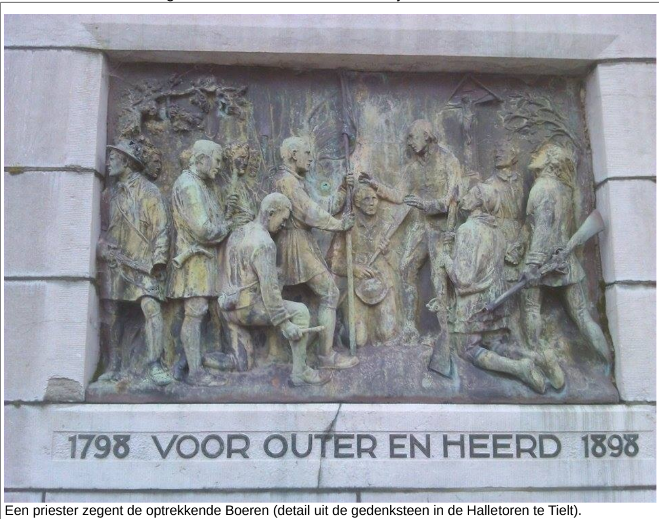
Een priester zegent de optrekkende Boeren (detail uit de gedenksteen in de Halletoren te Tiel).

Reactionairen, aanhangers van de keizer van Oostenrijk, notabelen...?