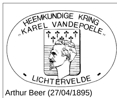
Arthur Beer (27/04/1895)

Eerste klas Koeienvleesch , Te bekomen bij Eug. Vanoverschelde van af 1,00 1,10 1,20 tot 1,40 de kilo. Eugène Vanoverschelde (14/03/1896)