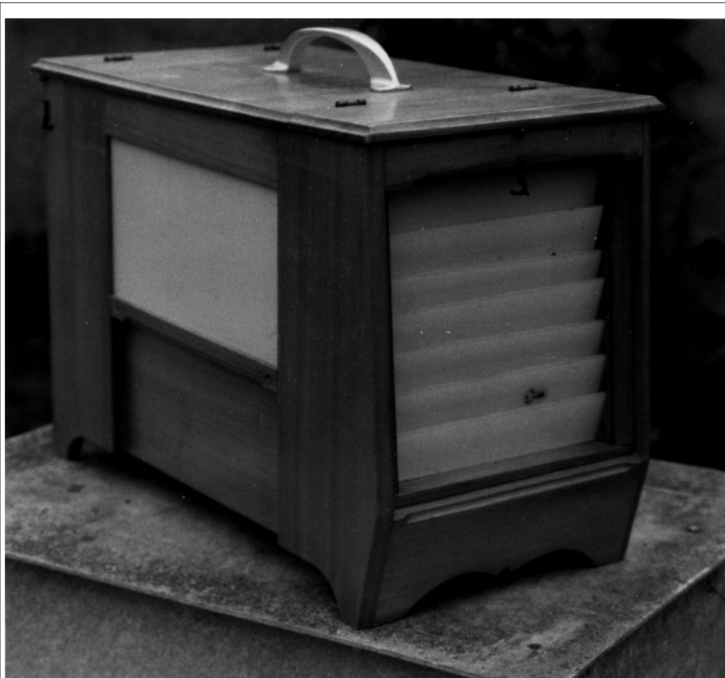
Foto: blinde kooi met melkglas.