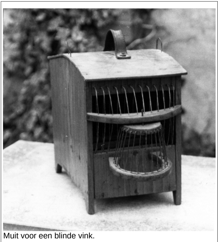
Muit voor een blinde vink.

“Waar kunnen wij nog beter zijn dan bij ons beste vrienden...”