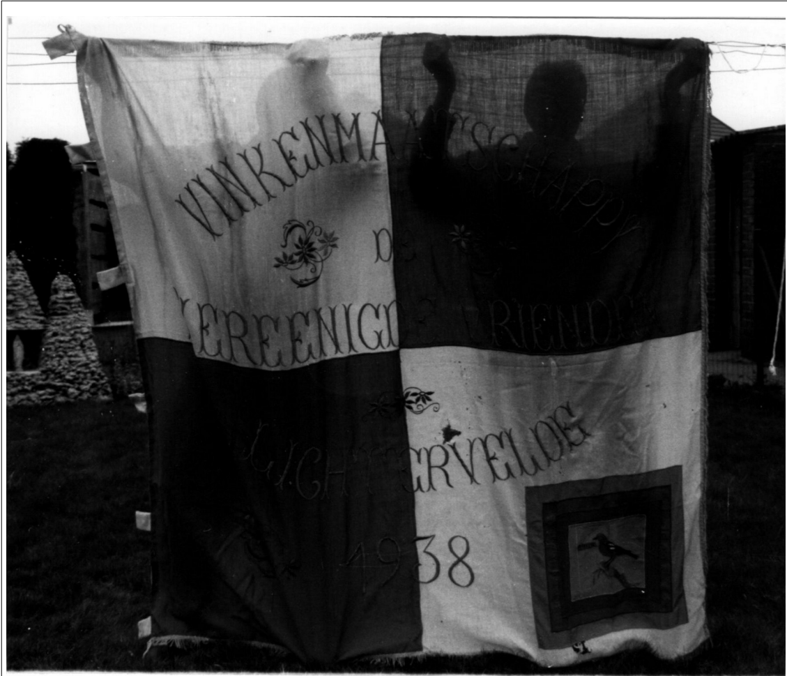
De eerste vlag van de vereniging.