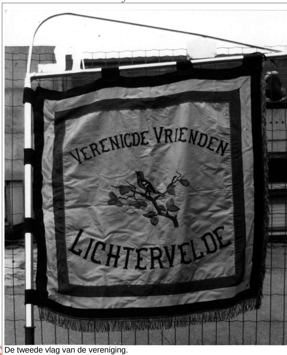
De tweede vlag van de vereniging.

Hij looft uitbundig de eendracht en de toewijding van "De Verenigde Vrienden". 50 leden namen deel aan de viering.