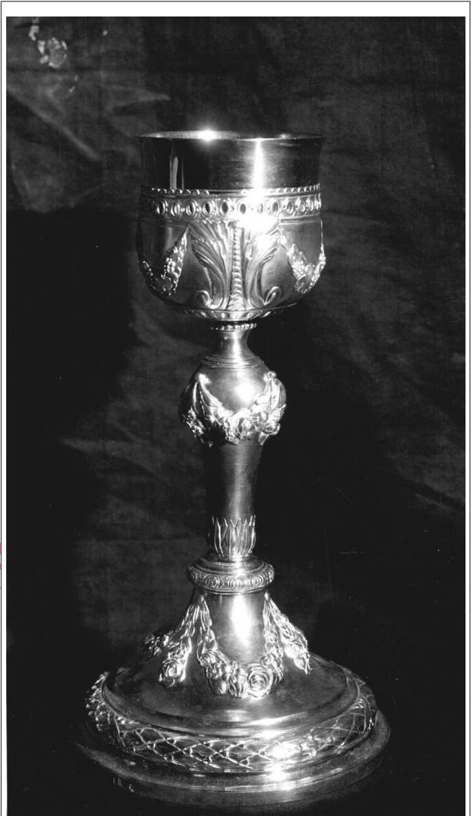
Zilveren Kortrijkse kelk uit de Lichterveldse St. Jacobskerk. Werk van edelsmid Pierre Waldack uit 1784.

Zelfs de trouwe kerkganger krijgt zelden al dit fraais van dichtbij te zien, en daarom meenden wij dat het de moeite loonde een paar van deze stukken even nader te bespreken en ze te situeren in het kader van het kunstambacht der Vlaamse edelsmeden.