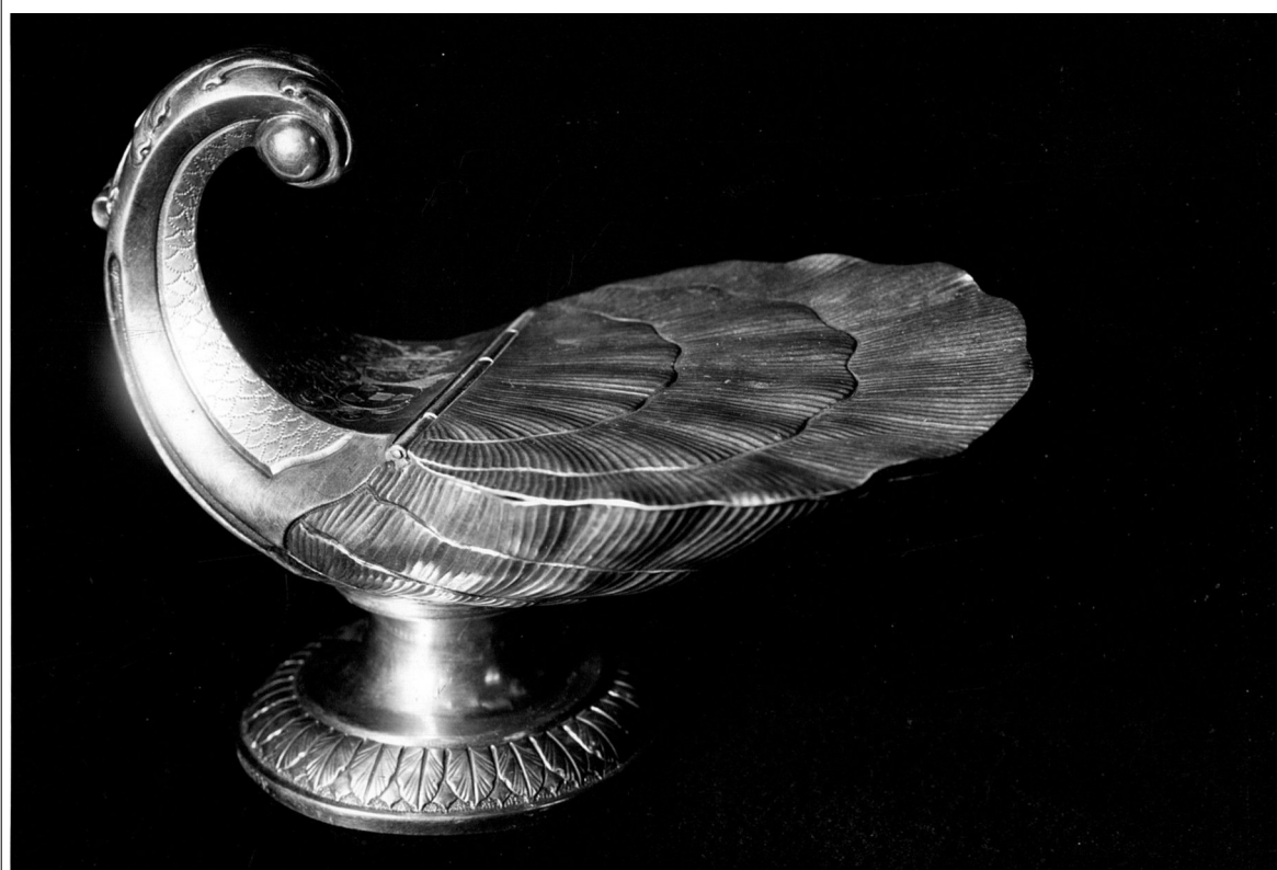
Wierookscheepje uit 1720.

Dit stuk rust op een ronde voet met bladrand. Op de welving van de voluutvormige greep