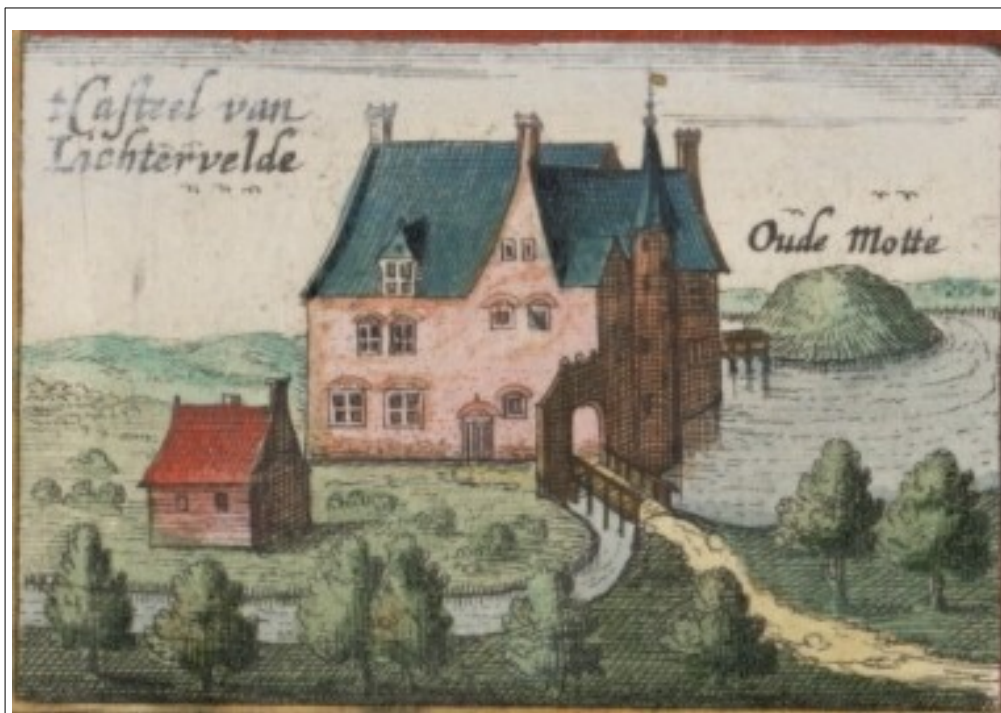
Zo tekende Anthonius Sanderus het Lichterveldse kasteel op het Hoge.