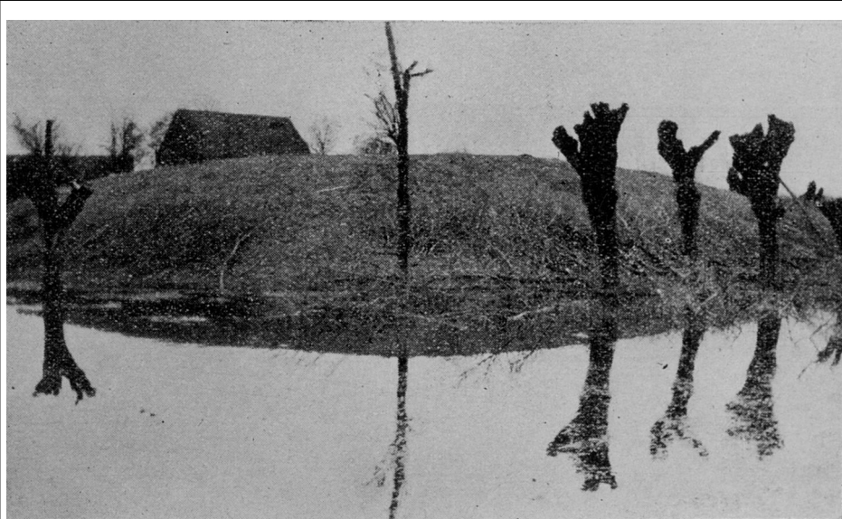
Deze foto toont wat in 1938 nog overbleef van het kasteel te Koolskamp: enkel nog de kasteelmote met wal. Alles werd in de jaren '50 genivelleerd.