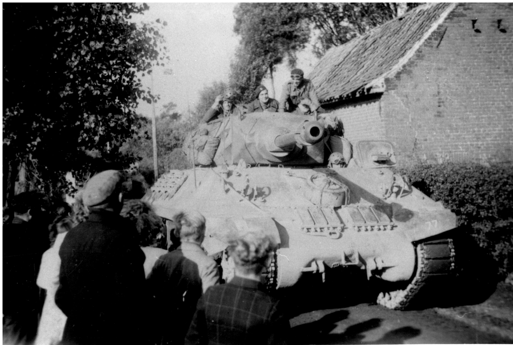
De eerste Poolse tank.

Van zodra de Duitsers weggetrokken waren uit Lichtervelde begon de bevolking met het maken van vlaggen voor de bevrijders: Belgische, Amerikaanse, Canadese, Britse, ... maar zeker geen Poolse. Het was dan ook een verrassing wanneer men de Poolse zwartmutsen Lichtervelde zag binnentrekken. Van zodra men het nieuws hoorde dat de soldaten zich nabij de wijk "de Kruisstraat" bevonden, trokken heel wat mensen daar naartoe.