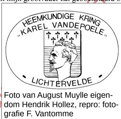
Foto van August Muylle

Alleen blijft de herinnering om die plaats zweven en ik voel die om mij heen waren, wanneer ik daar voorbij ga. En dat doet me goed. Ik weet dat het bestaan van mijn grootvader zal geboekstaafd blijven voor het nageslacht.