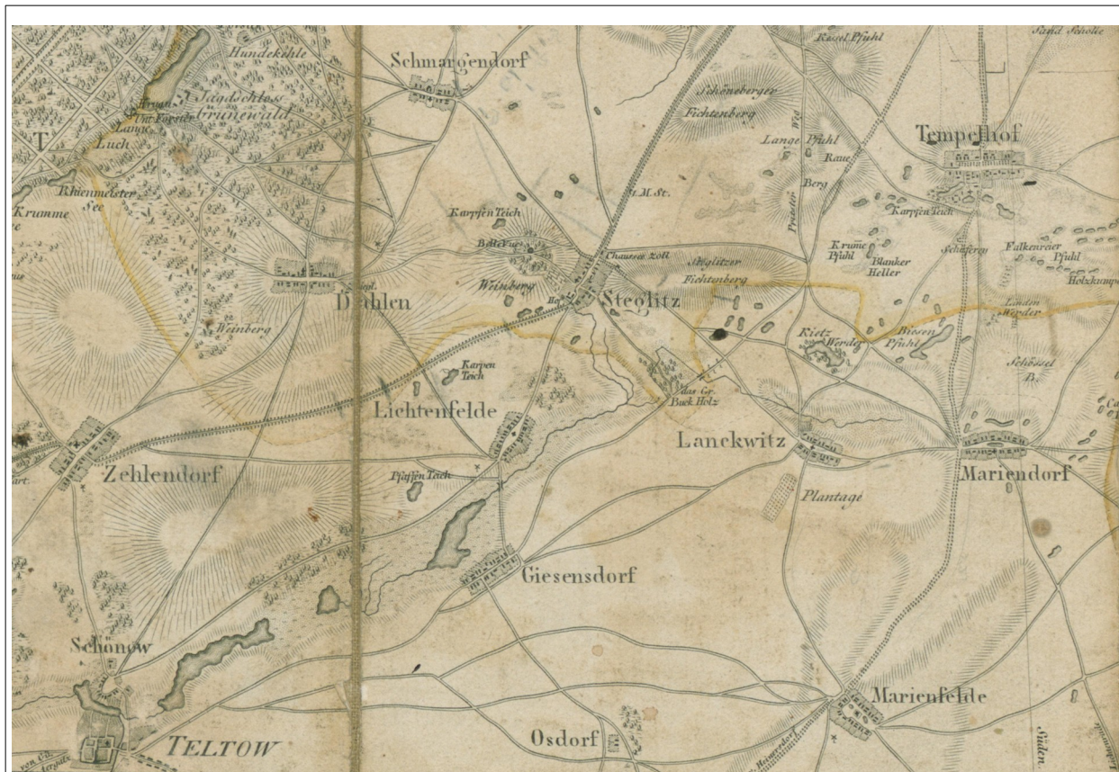
Topografische kaart van Lichtenfelde en omliggende, omstreeks 1816.

landlieden uit onze streken in het gebied rond het huidige Berlijn, omdat ze in die streek hun thuisland herkenden. Het is inderdaad zo dat de bossen, zompige moerassen en de zandruggen van het braakland aldaar een sterke gelijkenis vertoonden met het Houtland in West-Vlaanderen.