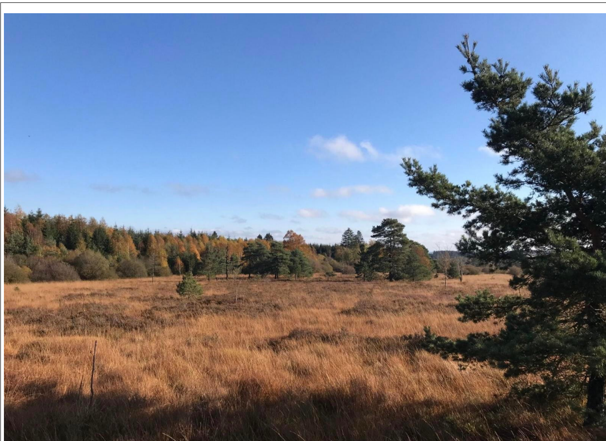
Afbeelding 5: Foto van de heide op het Plateau des Tailles (of plateau van le Baraque Fraiture) - https://nl.wikiloc.com