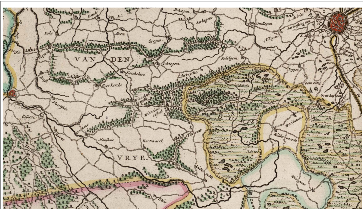
Afbeelding 2: Kaart van Frederik de Wit (1630-1706)

De ontginning van het grote heidegebied in Binnen-Vlaanderen begon reeds in de Romeinse tijd, zowat 2000 jaar geleden. Waarschijnlijk is het eerste gedeelte van het Lichtervelde "Veld" ook in die tijd ontgonnen. De archeologische -Romeinse- vondsten in de buurt van de Kasteelstraat – Zwevezelestraat, zijn daar wellicht een aanwijzing voor. Inde middeleeuwen kreeg de ontginning een nieuwe impuls. De opkomst van de steden, de uitbreiding van de handel en de snelle bevolkingsaan-groei tijdens de 12 de en de 13 de eeuw, hadden ook voor de natuur in Vlaanderen belangrijke gevolgen. Een grotere voedselproductie vereist nieuwe landbouwontginningen. Zo schonk gravin Johanna van Constantinopel in de 13 de eeuw het Lichtervelde "Veld", een woeste grond, gelegen op het grondgebied van Zedelgem, Veldegem, Torhout, Gits en Lichtervelde, aan de Cisterciënzerabdij "Ter Duinen" met als opdracht er landbouwgrond van te maken. De vraag naar hout als brandstof en bouwmiddel nam ook geweldig toe. Brugge ontgon naar het oosten toe tot Beernem; Gent ontgon in westelijke richting tot Aalter. Het "Veld" van Lichtervelde bleef echter veel langer in zijn natuurlijke oorsprong. Dit kan wellicht verklaard worden door de geringere vruchtbaarheid van dit gebied.