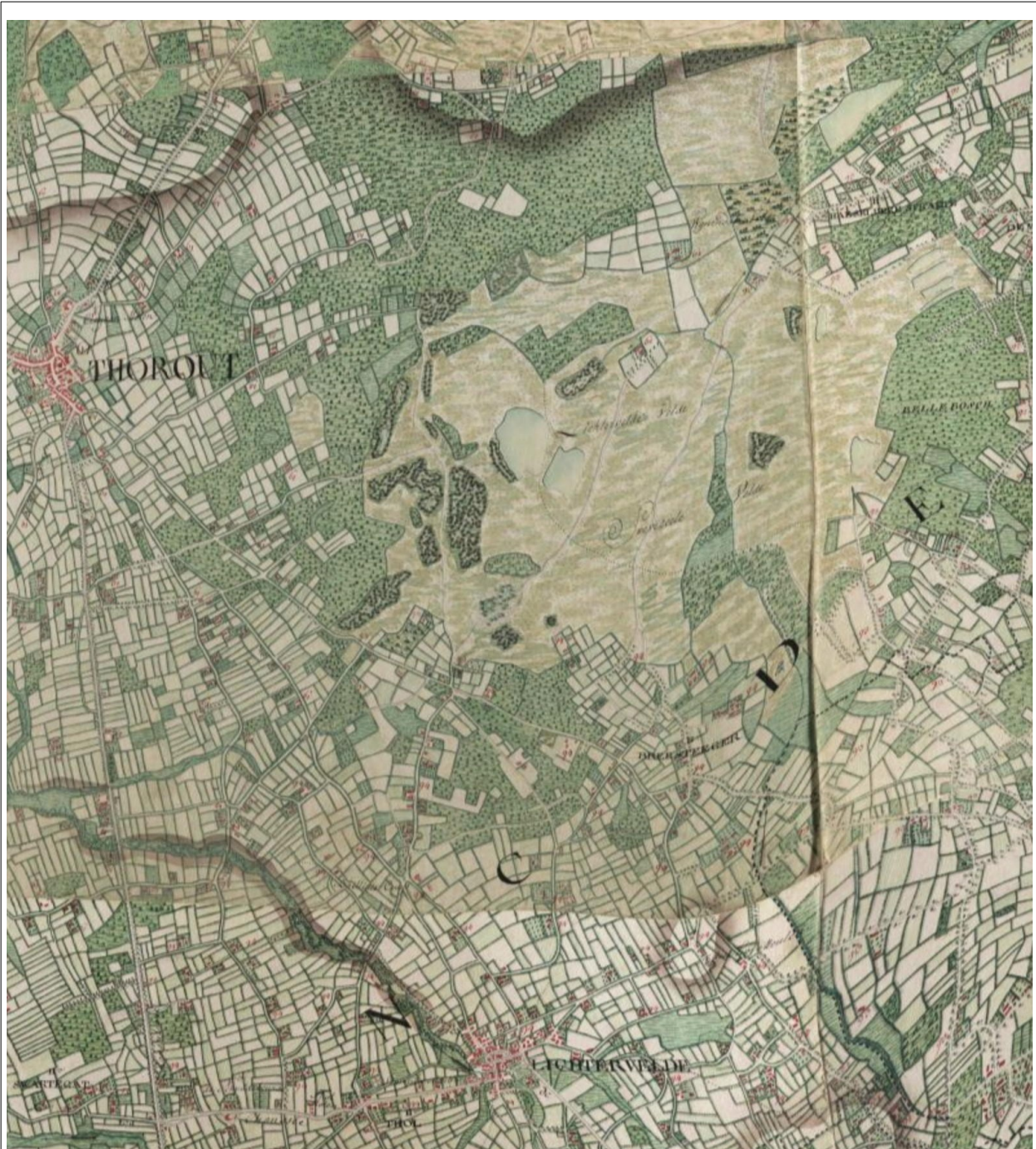
Afbeelding 1: Uittreksel uit de Ferrariskaart (1770-1777)

Een ander opvallend element in dit open landschap waren de talrijke wateroppervlakken. Het waren grote plassen, waarvan het water op een natuurlijke wijze werd afgevoerd, of gesloten kommen en moerassen. De beschrijving toont aan