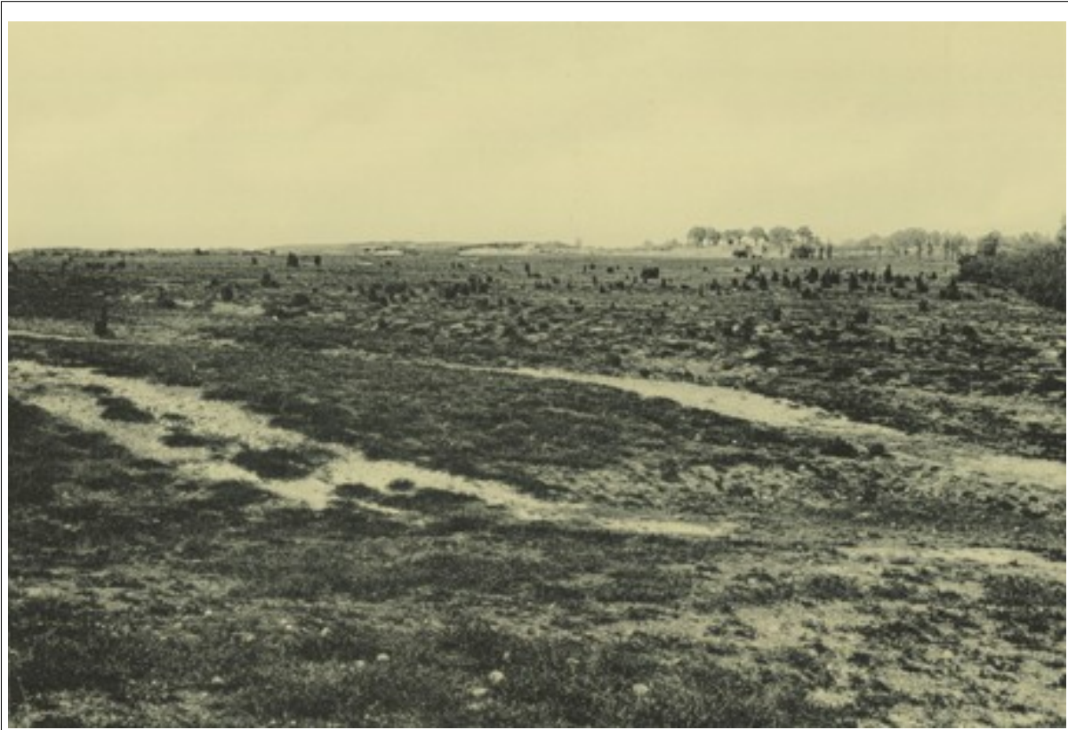
Afbeelding 4: Foto van droge hei te Winterslag (Genk) anno 1904.

Foto's van oude en nog bestaande heidegebieden kunnen een beeld geven van hoe het “Veld” er in de jaren 1700-1800 kan uitgezien hebben.