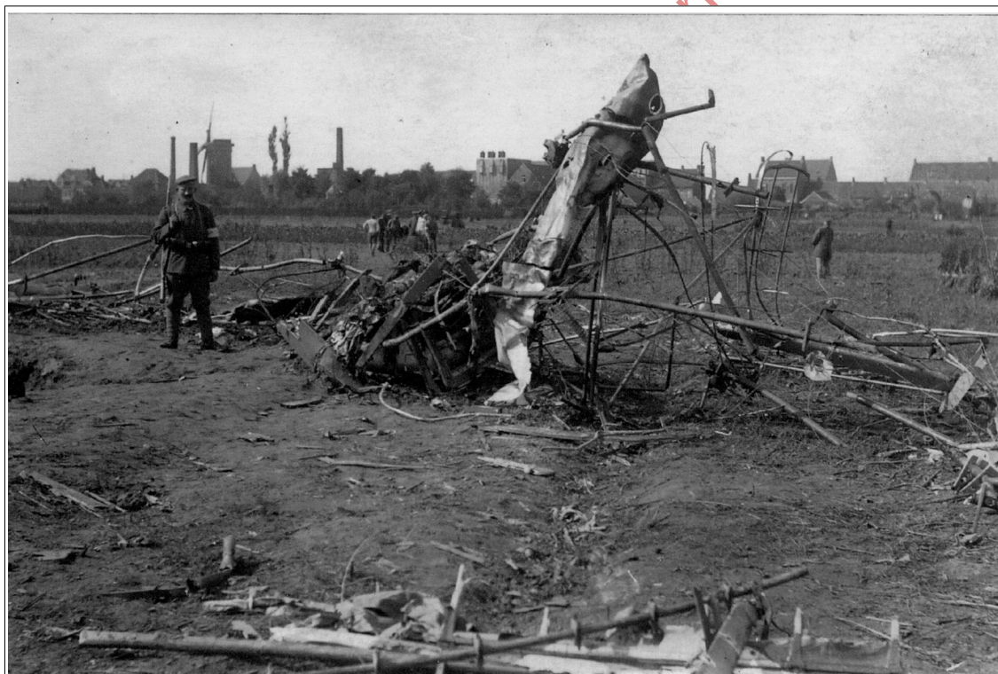
Het wrak van het toestel wordt bewaakt terwijl van op afstand de burgers toekijken. In de verte zien we de achterkanten van de huizen van de Stationsstraat, met links de molen van Devos. Ernaast merken we de cichorei-ast van de gebroeders Depuydt. De lange nok rechts is die van het Oude-Manhuis.

Na enige tijd was Lichtervelde vaak het mikpunt van de geallieerden die met bombardementen poogden de bevoorrading van de vijand te minimalizeren. Dit gebeurde vaak ten koste van slachtoffers onder de burgerbevolking.