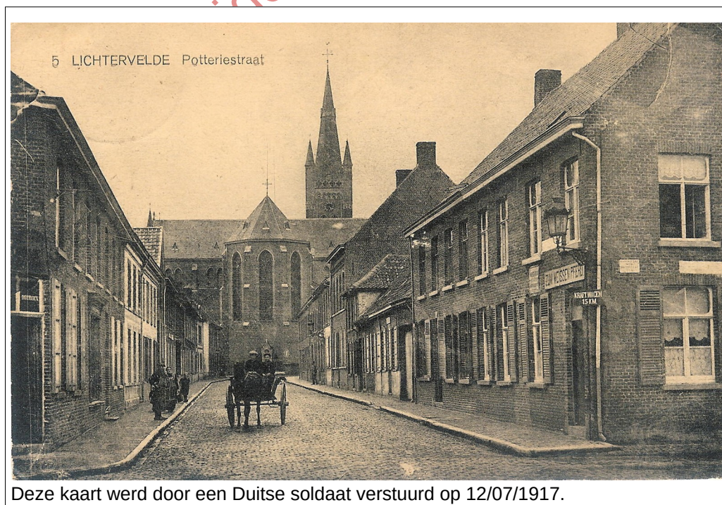
Deze kaart werd door een Duitse soldaat verstuurd op 12/07/1917.

De begrafenis in de oorlogsperiode was zeer eenvoudig. Het lijk werd in een houten of zinken kist gelegd. Men voerde het dan op een duwkarretje of rolwagentje tot aan de pastorie. Daar prevelde de geestelijkheid enkele gebeden, las wat voor, gaf de zegen en na enkele minuten was alles afgelopen. Het lijk werd dan verder doorgevoerd tot aan het kerkhof. Dit ritueel was toepasselijk voor de meeste burgerlijke slachtoffers.