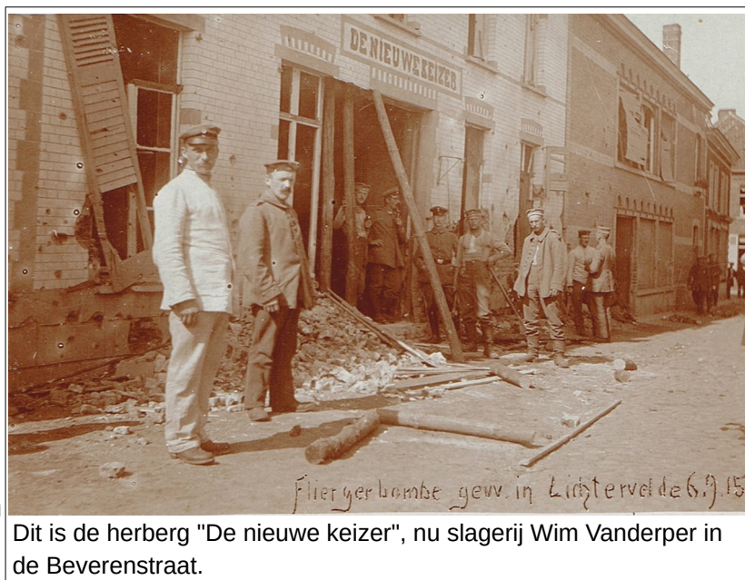
flieryerbombe gew. in Lichtervelde 6.9.15 Dit is de herberg "De nieuwe keizer", nu slagerij Wim Vanderper in de Beverenstraat.

Tijdens de zomer van het jaar 1917 scheerden opnieuw enkele geallieerde vliegtuigen over Lichtervelde. De Duitsers hadden om de geallieerden te misleiden een vals station gemaakt en hun opzet slaagde. De geallieerde piloten vergisten zich van doel en het echte station bleef ongedeerd. Maar op de vierde augustus was het toch raak.