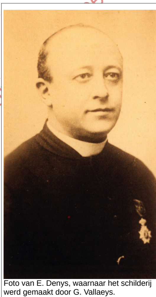
Foto van E. Denys, waarnaar het schilderij werd gemaakt door G. Vallaeys.

Kerk en geestelijkheid die in de normale negentiende eeuwse samenleving nog grotendeels de morele en religieuze leefregels van de gemeenschap bepaalden, zagen in het veranderde tijdsbeeld een duidelijke bedreiging van hun machtspositie. De gemeenschap van een dorp of parochie was verbroken door de maandenlange afwezigheid van het grootste deel van de mannelijke bevolking. Wie weet aan welke invloeden ze niet zouden blootstaan in het "goddeloze Frankrijk". Wie weet welke gewoonten of ideeën zij niet zouden meebrengen naar huis.